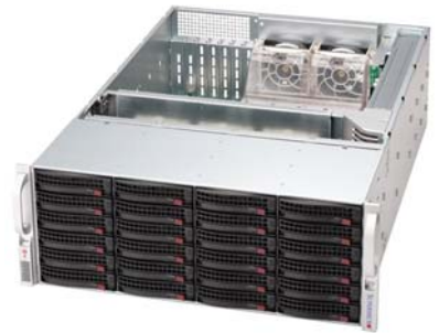
L2K Data Storage Server u verziji sa do 24 hot swap SAS/SATA diska

je sveobuhvatno IP-Storage rješenje, koje nudi organizacijama svih veličina NAS i iSCSI (target i initiator) funkcionalnost unutar jednog servera, s vrhunskim managementom i superiornom pouzdanošću.